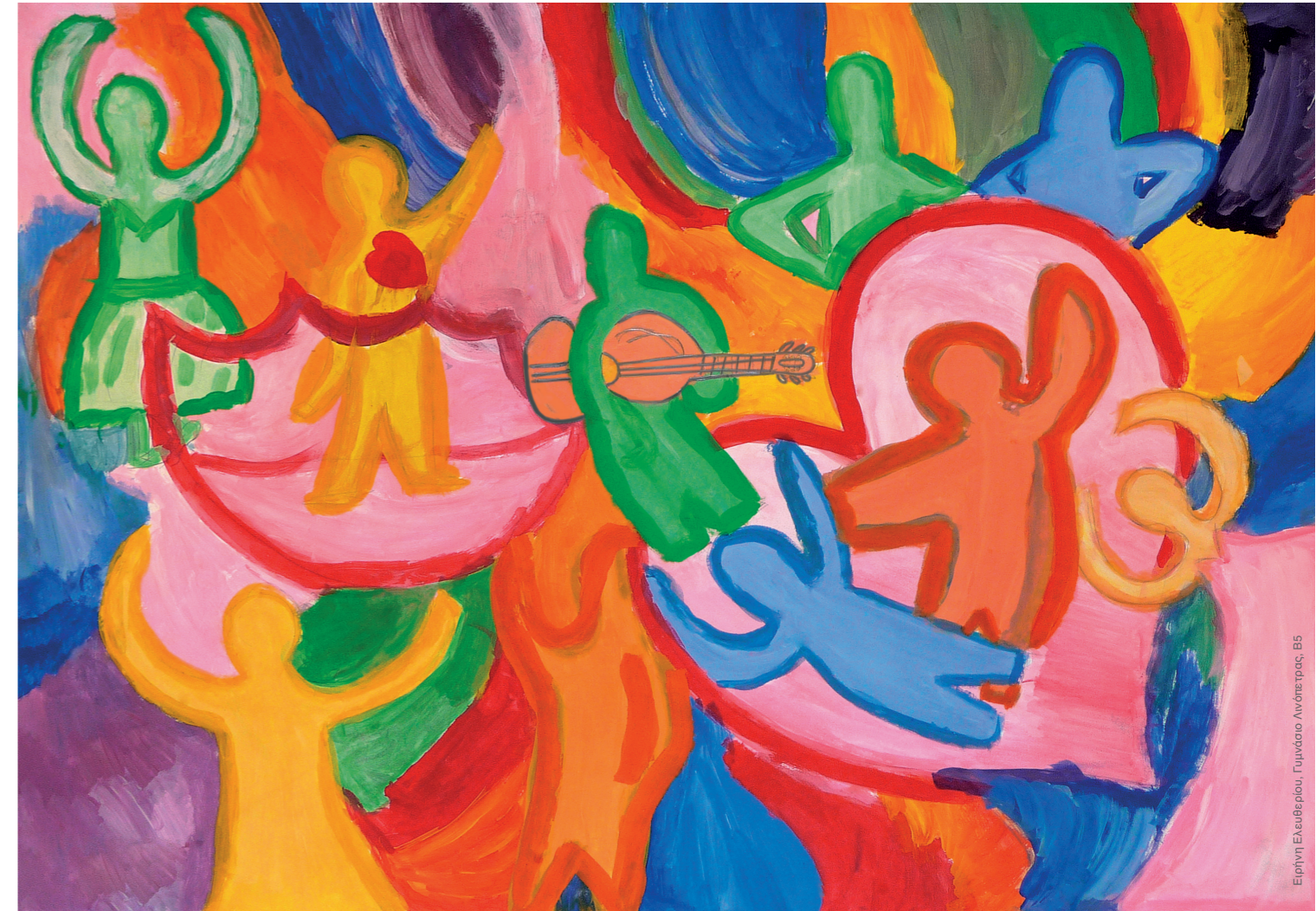
Ειρήνη Ελεαθερίου, Γυμνάσιο Λινάτσας, Β5

Поддержите наши усилия. Заполните и отправьте регистрационную форму «Друзей Кераки» по адресу, указанному ниже, вместе с символическим ежегодным взносом в размере €10,00.